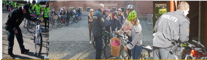
Politi-briefing – 2 klasser

Ved politiets ankomst er klasserne opstillet med cykler og hjelme i f.eks. Skolegården