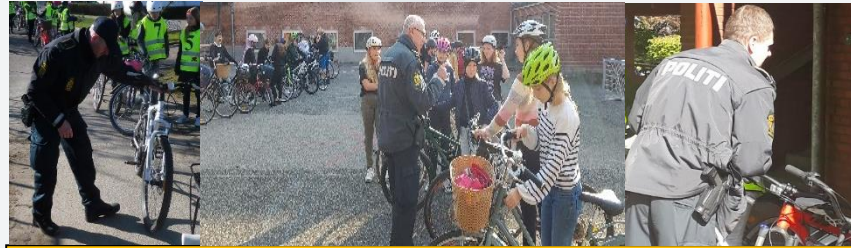
Politi-briefing – 2 klasser

Ved politiets ankomst er klasserne opstillet med cykler og hjelme i f.eks. Skolegården