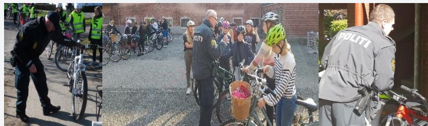
Politi-briefing – 3 klasser

Ved politiets ankomst er klasserne opstillet med cykler og hjelme i f.eks. Skolegården